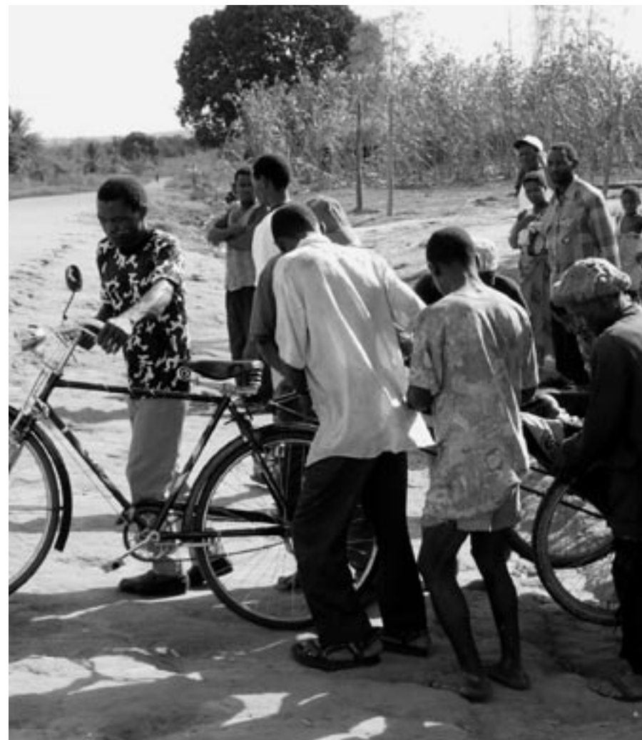
Eine gemeinsame Projektidee von SolidarMed und Wiwanana: Im Anhänger werden die Patienten per Fahrrad zur nächsten Gesundheitsstation gefahren.