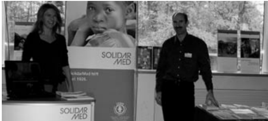
Zum ersten Mal prägnante Präsenz markiert: Am SGAM-Kongress vom 10. bis 12. November 2005 in Luzern.