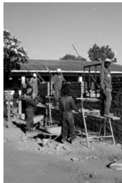
Bauarbeiten am neuen Sprechstundengebäude des Musiso-Spitals.