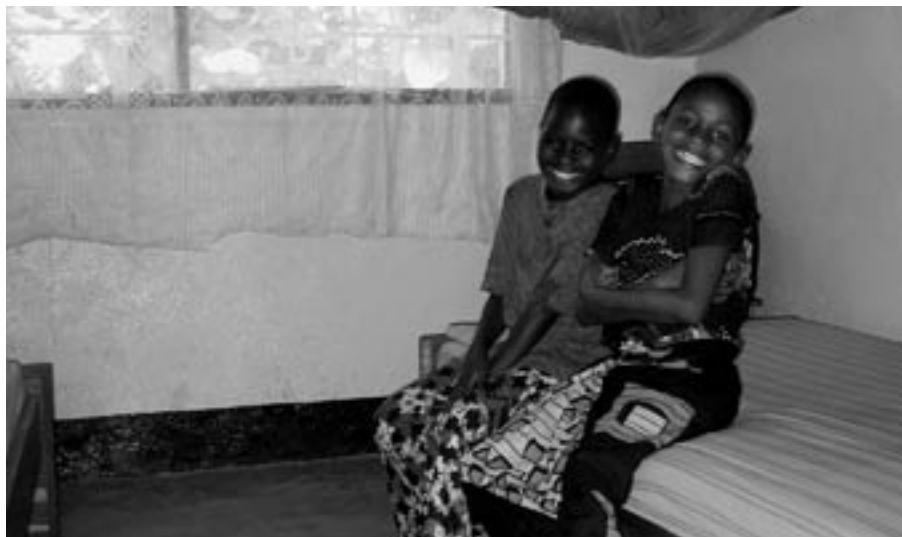
...und Mädchen im neuen Mädchentrakt.