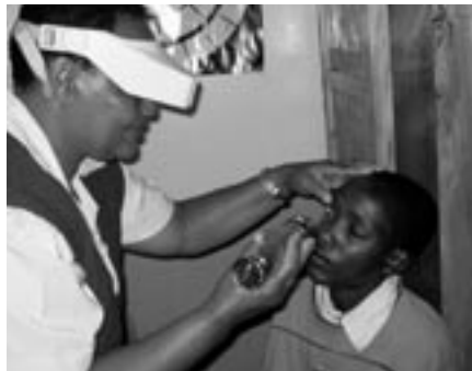
Das Dareda-Spital wird um verschiedene medizinische Dienstleistungen erweitert, unter anderem erhält es eine funktionsfähige Abteilung für Augenbehandlungen.