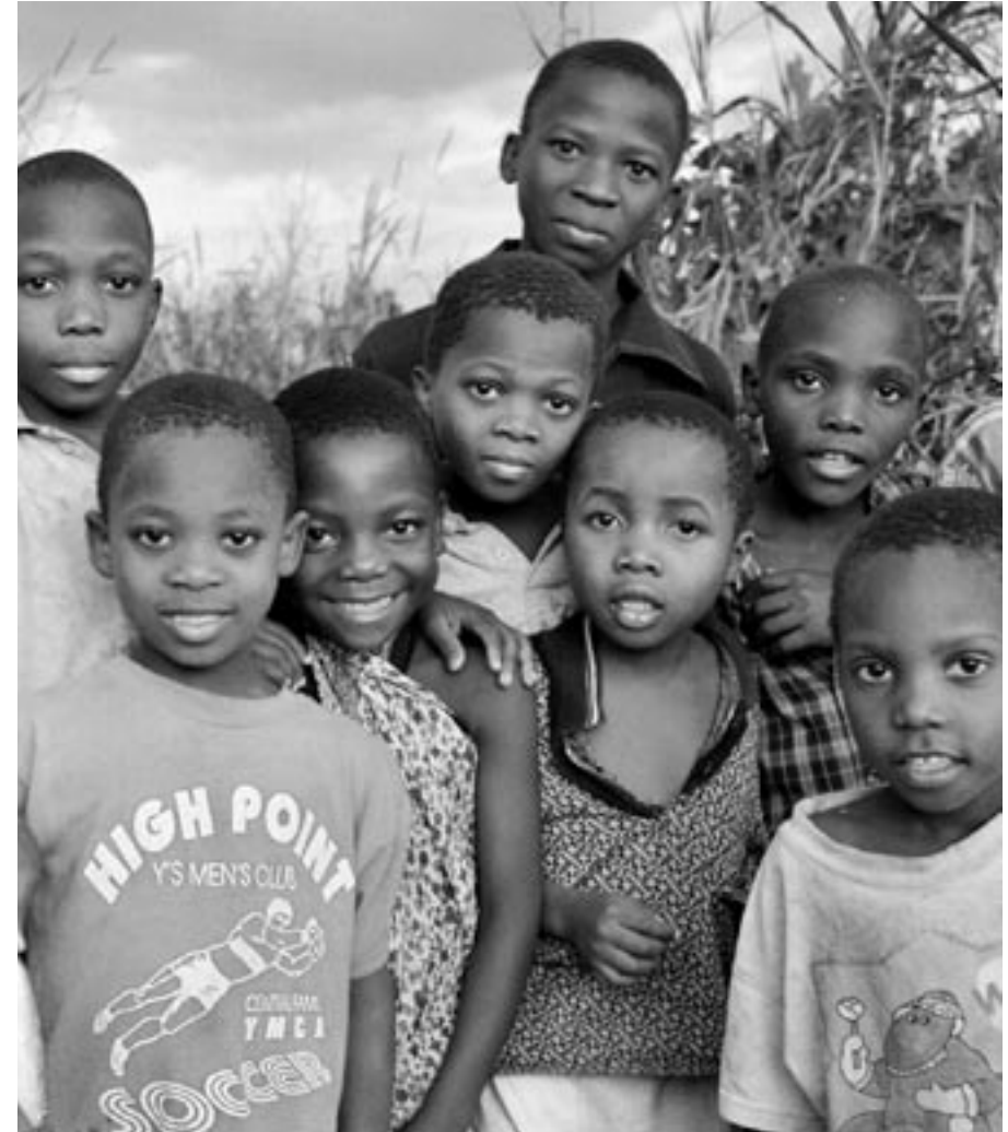
Sollen die Kinder Afrikas eine Zukunft haben, so muss der Kampf gegen Aids weiter gehen. Kinder am Furuu-Fluss in Malinyi, Tanzania.

SMART zeigt gute Fortschritte und durchdringt das ganze derzeitige Schaffen von SolidarMed. Keine Mitarbeiterin, kein Mitarbeiter, weder in unseren vier Einsatzländern noch in der Schweiz, wird nicht durch diese grosse Aufgabe gefordert. Die umsichtige Planung und die ganzheitliche Vorgehensweise zeigen schon erste positive Ergebnisse. SMART muss aber nach dieser ersten, von der DEZA finanzierten, Projektphase unbedingt weitergeführt werden. Denn der Kampf gegen Aids unterscheidet sich wesentlich von anderen Katastrophen – wie zum Beispiel Naturkatastrophen – wo es nach der ersten Nothilfe in erster Linie um Infrastrukturmassnahmen geht. Sind die abgeschlossen, kann das Leben grob gesehen wieder weiter gehen. Wollen wir aber Aids in Afrika besiegen, respektive kontrollieren, müssen bestehende Strukturen grundlegend geändert werden und dies nicht nur im klinischen, medizinischen, organisatorischen und gesellschaftlichen Bereich. Nötig sind auch Veränderungen in Politik und Wirtschaft, damit Gesundheits-Massnahmen auch langfristig und breitenwirksam greifen können, die Menschen überhaupt das nötige Wissen und Geld haben, um sich adäquat schützen