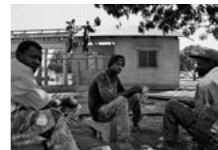
Ziegelherstellung sowie Dachdeckerarbeiten für den Bau des Gesundheitszentrums Namogelia.