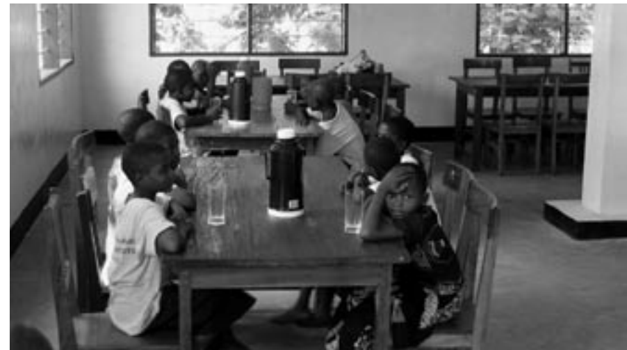
2005 wurde der grösste Teil der Renovations- und Erweiterungsarbeiten für das von der Franziskanerkongregation in Itete geführte Heim für Aids-Waisen ausgeführt: Kinder am Esstisch im neuen Aufenthaltsraum...

triebswirtschaftlichen Analyse der 15 Krankenstationen der Diözese. Diese wird der Diözese dazu dienen, auch die Leistungsfähigkeit dieser kleineren Einheiten über die kommenden Jahre systematisch zu steigern.