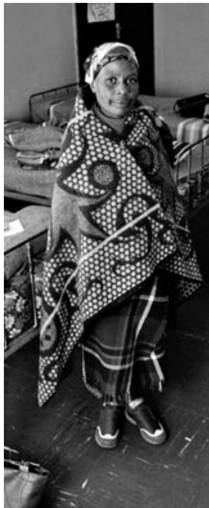
Hat trotz Aids endlich wieder Hoffnung: schwangere, HIV-positive Frau im Seboche-Spital.