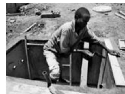
Arbeiten für den Neubau des Gesundheitszentrums Ocua.