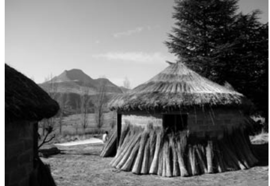
Das Maternity Waiting Home beim Seboche-Spital kurz vor seiner Fertigstellung.

Eine ebenfalls positive Entwicklung ist, dass die Regierung Lesothos nach jahrelangen