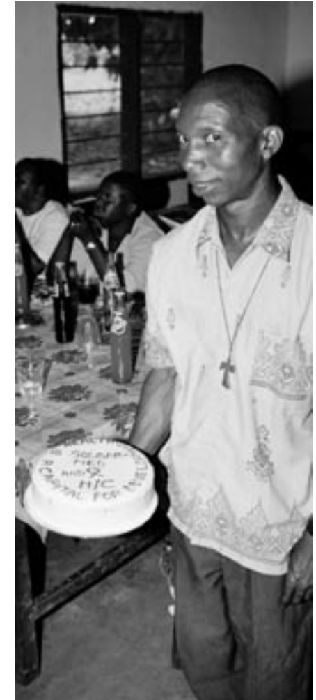
SolidarMed hat im «Katastrophenjahr» 2005 glücklicherweise nicht wesentlich weniger vom «Spendenkuchen» abbekommen.