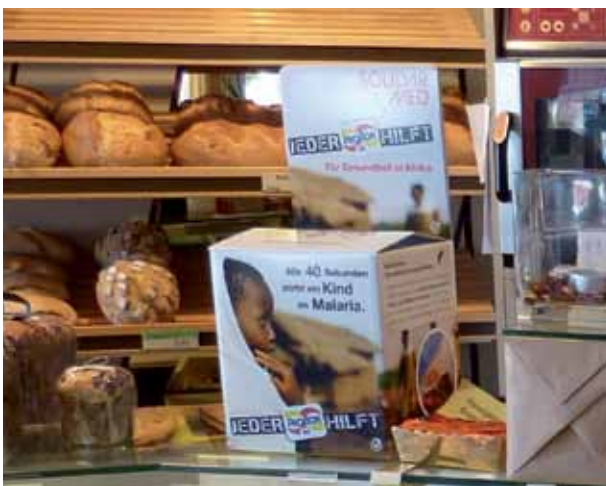
Die ProBon-Sammelbox in einer Bäckerei. Dank den engagierten Kunden retten Rabattmarken sogar Leben.

Auch die Kundinnen und Kunden von über 200 Fachgeschäften zeigten sich in der Weihnachtszeit wieder sehr grosszügig. Zugunsten der Menschen in Afrika verzichteten sie auf ihre Rabattmarken und spendeten die Sammelkarten an SolidarMed. Eine volle ProBon-Karte hat den Wert eines imprägnierten Netzes, das eine Familie wirksam vor Mückenstichen und damit vor Malaria schützt. Herzlichen Dank!