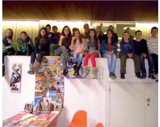
Schüler/innen aus Pratteln informieren die Bevölkerung und sammeln äusserst erfolgreich für das Lugala-Spital in Tanzania.

Seit 2010 engagiert sich die Sekundarschule Pratteln mit dem Projekt «Matingatinga» für SolidarMed. Am Beispiel des Lugala-Spitals erfahren die Schüler/innen, wie Kinder im ländlichen Afrika leben und welche gesundheitlichen Herausforderungen ihr Leben erschweren. Dieses Wissen geben sie in verschiedenen Aktionen an die Bevölkerung von Pratteln weiter und sammeln dabei fleissig Spenden. Im vergangenen Dezember organisierten die Schüler/innen einen Stand am Weihnachtsmarkt, ein Kerzenziehen und eine Ausstellung über das Spital, womit sie im Pratteler Winter etwas afrikanische Wärme verbreiten und erfolgreich Spenden sammeln konnten. Insgesamt kamen dank dem Engagement der verschiedenen Klassen über die Jahre mehr als 18'000 (!) Franken für das Lugala-Spital in Tanzania zusammen. Vielen Dank!