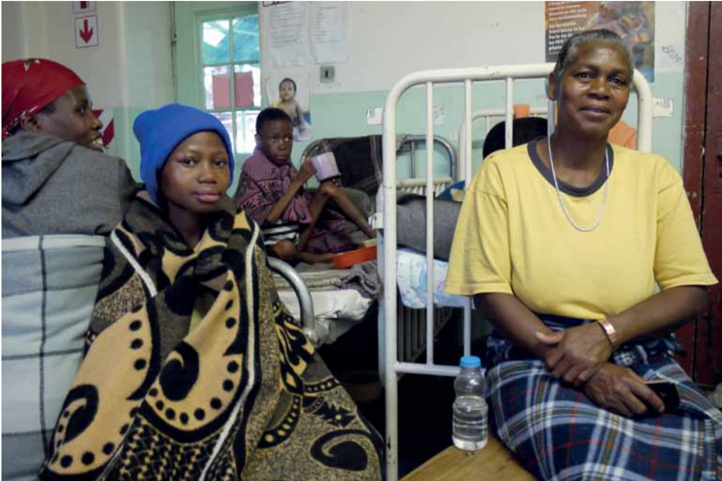
Der Winter sorgt für volle Betten in der Kinderabteilung des Paray-Spitals in Lesotho.